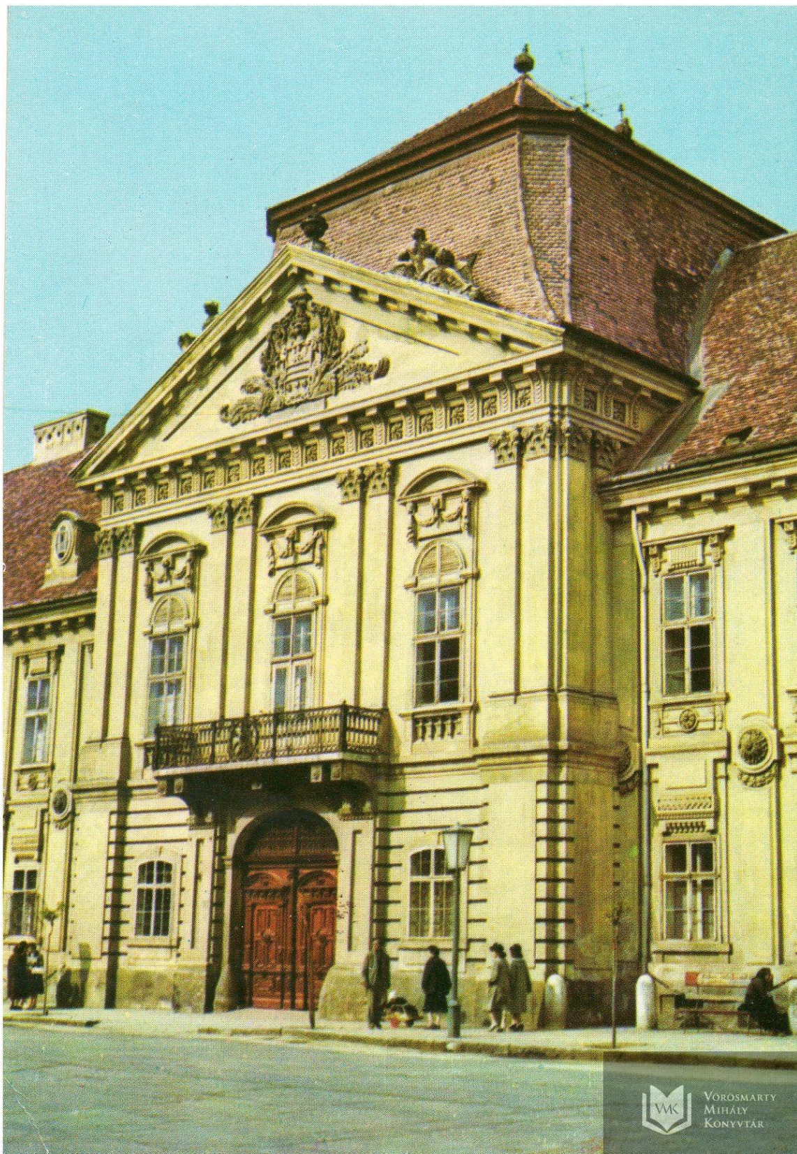
Székesfehérvár – püspöki palota