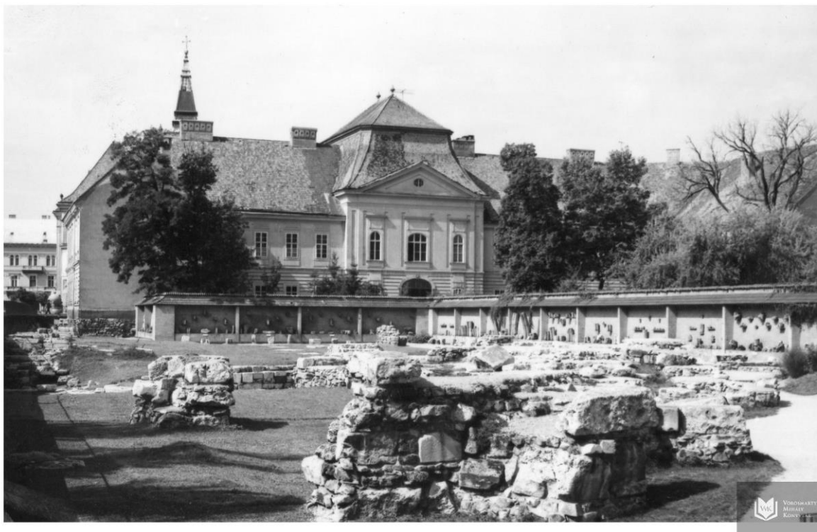
Székesfehérvár – A királyi romkert és mögötte a barokk püspöki palota

A barokk Székesfehérvár bemutatásakor rögzíthetjük, hogy az egyik legősibb magyar város 6 – amely „gazdagon kínálja a képző- és iparművészeti alkotásokat” 7 – az egyik leingergazdagabb korstílus által bőkezűen megáldott állapotában tárul elénk: a város egyik legtündöklőbb művészettörténeti-építészeti korszakával. Ez a barokk. De mit is értünk e korstílus alatt?